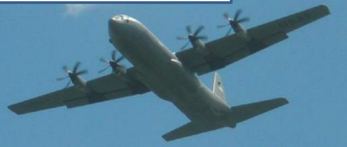
C-130 新型ハーキュリーズ

防衛省は『新型』はエンジンも改良され静かになったと豪語したが、これほどの訓練を基地周辺で行なうとは言ってなかった。