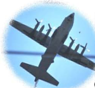
久保山町上空を飛行中の C130輸送機

11月2日(土) 12:30~20:00 11月3日(日) 9:00~17:00